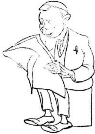
Armastus- ja veriste sündmuste romaani lugeja

Rahvas võttis Sakala vaimustusega vastu. Seda tõendavad kõige erinevamad allikad: baltisaksa aadlike ärritus, sajad ja sajad kirjad ajalehe toimetusse ning mälestused Sakala sõprade ja vaenlaste sulest.