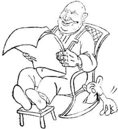
Politiilise elu ja muu nalja lugeja.