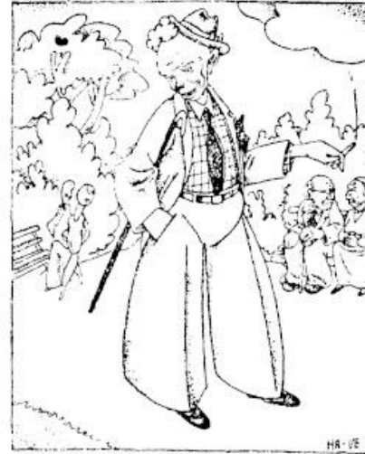
Üks, keda huvitab vaid tants, film ja mood . . .

Sakala karikatuur oma lehelugejatest. Mis uudiseid sina meedias (TikTokis) jälgid?